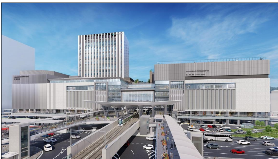
広島駅南口広場全景